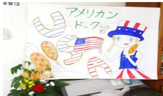
アメリカン ドッグ