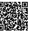
リワーク プログラム