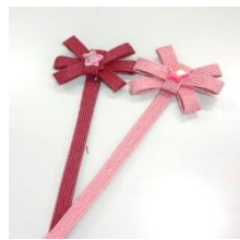
ブックマーカー (しおり)