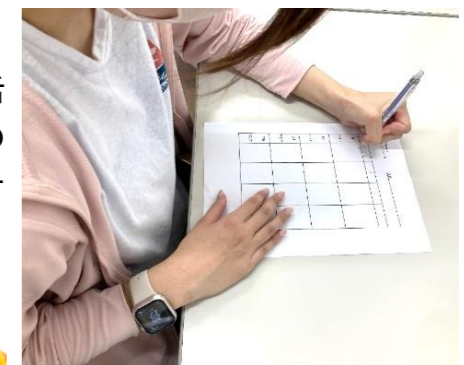
運動後のモニタリング

お一人で生活リズムが安定せず、そのことが日常生活に支障をきたしていると感じておられる方や、体力の回復、維持、向上を目指したい方はお気軽にお問合わせください。