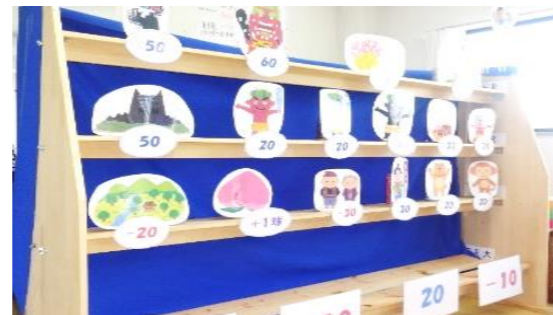
桃太郎缶倒しゲーム